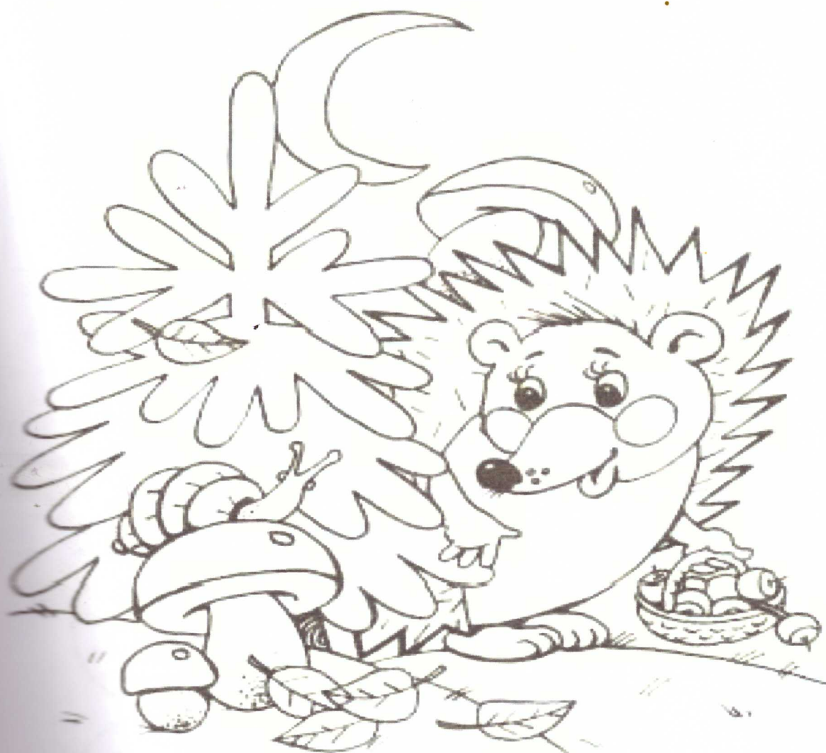
Рис. Е. Кузнецовой